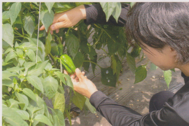
夏場は毎日収穫作業に追われている

どの作物にも良い点、悪い点はあるので自分に合う無理のない品目選びをするといいですね。設備投資を抑える工夫や努力も必ず成果があるので時間をかけて準備することが大事です。