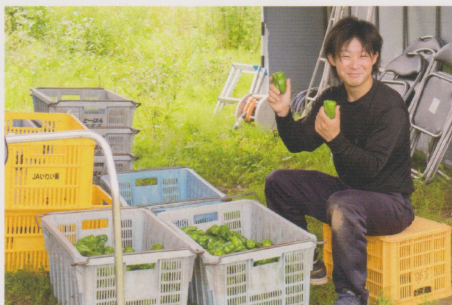
収穫したピーマンの選定作業