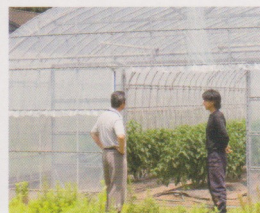
最盛期にはパートさんにも手伝ってもらいながら